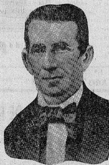
General Don José María Cañas